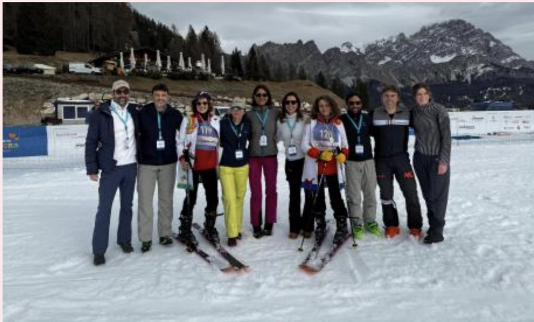
Il gruppo degli organizzatori della Cortina Charity Challenge, di fondazione Teodora e dell'associazione Friends for Others

SOGNI – Presenti anche la dottoressa MaDai e la dottoressa PerPiacere, due delle dottoresse Sogni attive sul territorio. Si tratta di artisti professionisti, assunti e specificamente formati dalla Fondazione Teodora, per operare in sinergia con il personale ospedaliero, nell'ambito di un processo di cura integrato del piccolo paziente. La stessa Fondazione si è già impegnata a tradurre il ricavato in speciali visite dei suoi Dottor Sogni ai bambini nei reparti pediatrici di alta complessità degli ospedali italiani in cui la Fondazione è attiva. Domani sera è invece attesa la charity dinner, su invito, alle ore 20 presso il Ristorante el Camineto.